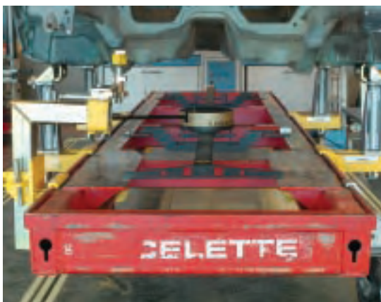
MEDIDOR NAJA MONTADO SOBRE LA BANCADA

C/ León, 63. Polígono Cobo Calleja 28947 FUENLABRADA (Madrid) Teléfono: 91 642 02 62 Fax: 91 642 01 69