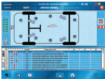
Puntos de control recomendados