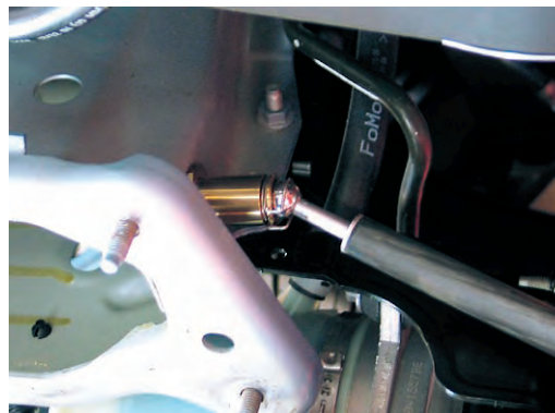
Detalle de la medición

Una vez terminada la medición previa para el diagnóstico de los daños, se inicia la reparación, efectuándose el control de los puntos de la carrocería durante la misma. Para facilitar la reparación, la pantalla indica la magnitud de las deformaciones y las direcciones de tiro recomendadas ✘