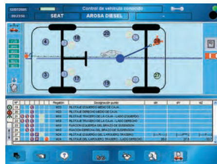
Presentación de las medidas