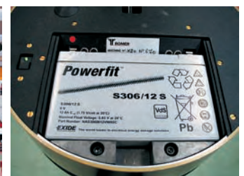
Batería, en la base del brazo medidor