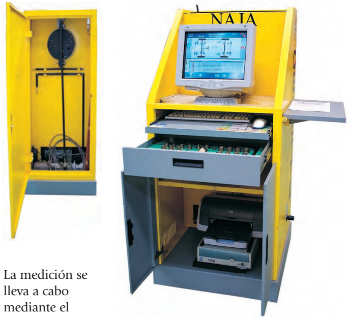
Disposición del equipo en el armario

La medición se lleva a cabo mediante el accionamiento de un pulsador existente en el brazo de medida. Al pulsarlo, la posición del brazo de medida y de sus articulaciones es enviada al ordenador mediante ondas de radio, con lo que se evita la utilización de cables de comunicación. La energía necesaria para el funcionamiento del brazo de medida se obtiene de una batería recargable, insertada en la base del propio brazo. El equipo cuenta con dos baterías intercambiables y un cargador, por lo que su funcionamiento está asegurado en todo momento.