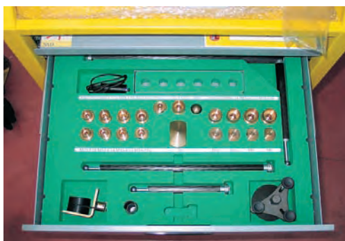
Accesorios del equipo

El brazo de medida, que se sitúa sobre el raíl, permite medición de todos los puntos de la carrocería, merced a su desplazamiento sobre el raíl y a las diferentes articulaciones que presenta.