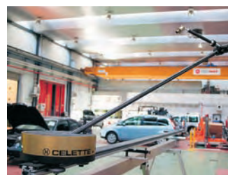
Brazo de medida, sobre el raíl