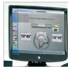
Giro para medición de Avance