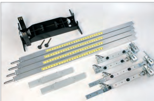
Kit de barras para alinear camiones