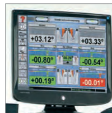
Medidas eje delantero