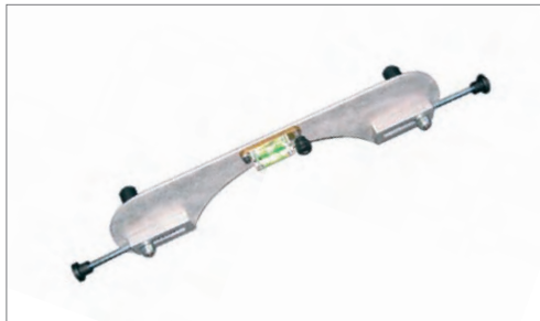
Nivel de volante de alta precisión

A su disposición se encuentra un completo programa de accesorios para cubrir todas las necesidades del taller, incluso podemos proporcionarle software de Mercedes o VAG Multilink.