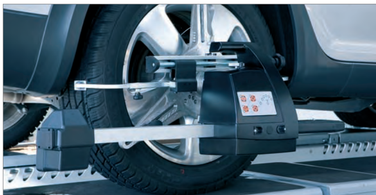
Captador con Garras Opcional de 3 puntos

La sofisticada técnica de medición CCD permite una transmisión inalámbrica de los datos, a la vez que garantiza la máxima precisión de los resultados. 4 captadores que incluyen 8 sensores permiten una medición de la situación de 360° alrededor del coche.