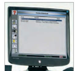
Banco de datos cliente