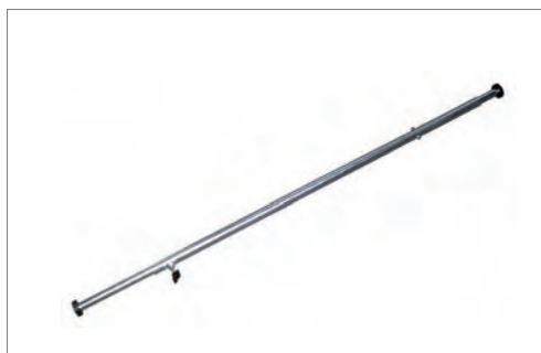
Barra de Convergencia

For significantly increased productivity in wheel alignment!