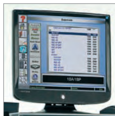
Selección del vehículo

Pantallas claras y de fácil lectura para el operario.