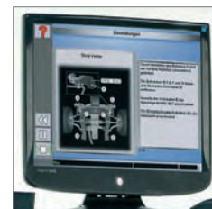
Fotos de ayuda