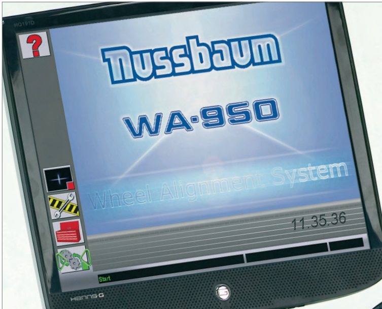
Monitor TFT de alta calidad

En www.nussbaum-lifts.de obtendrá sin coste documentación actualizada sobre alineación, las actualizaciones versiones de software son gratuitas. Además, una vez al año, puede obtener a través de su distribuidor Nussbaum, la actualización del banco de datos de vehículos que sale a la ventapor un reducido precio.